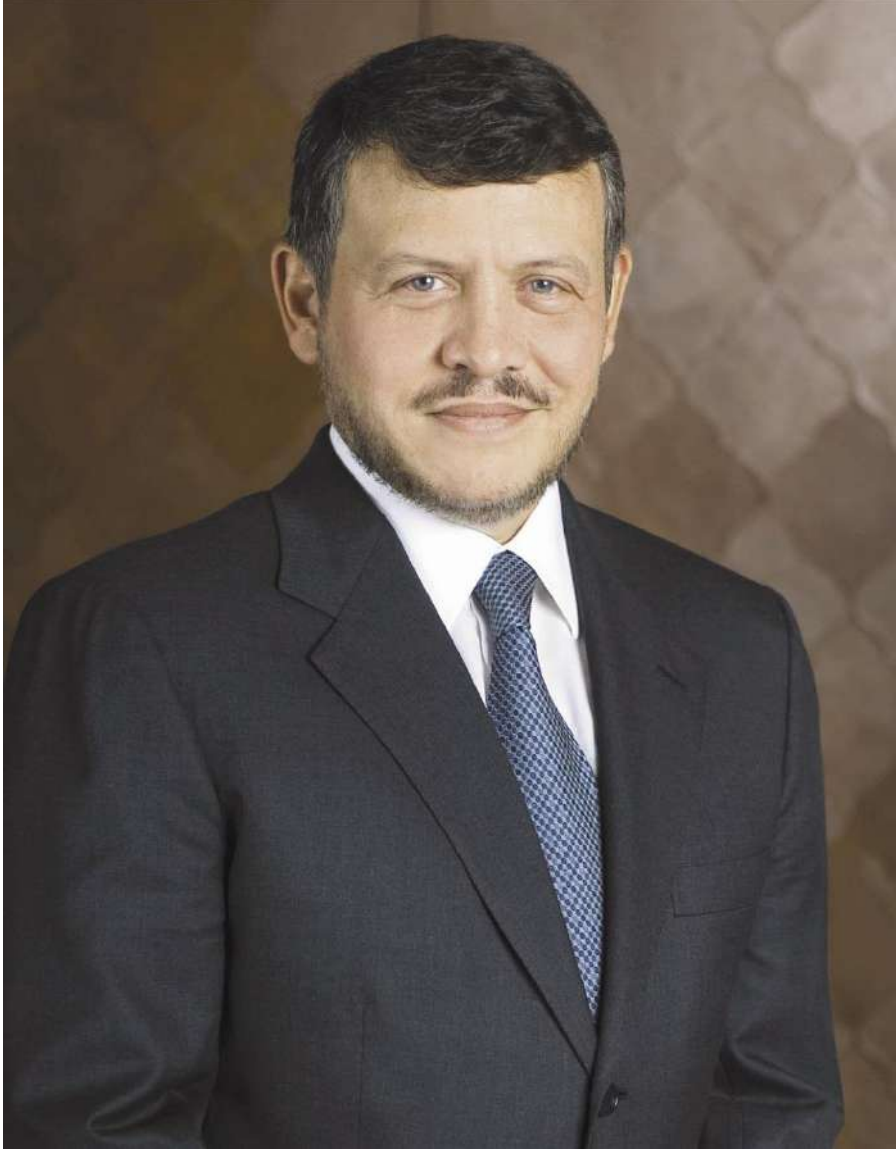
جلالة الملك عبد الله الثاني ابن الحسين المعظم