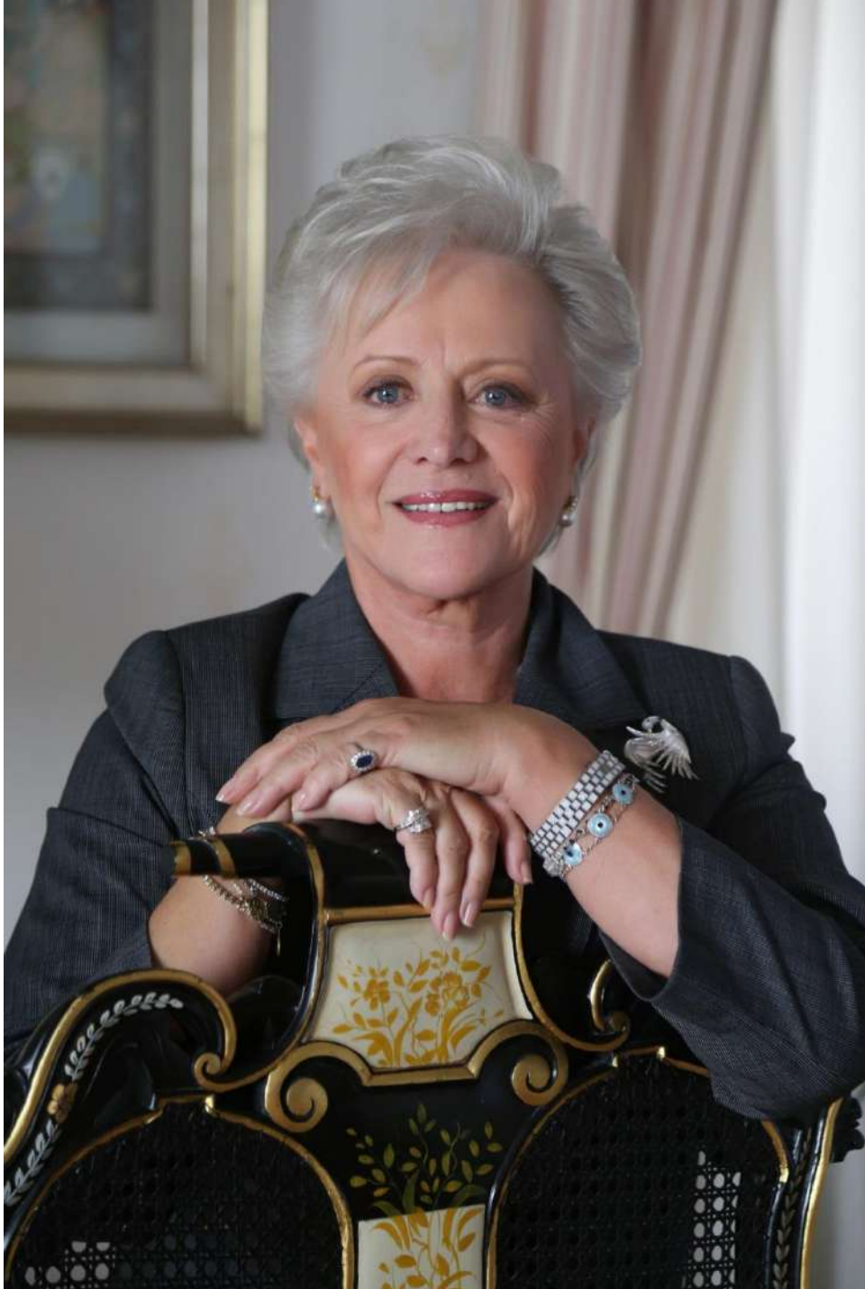
صاحبة السمو الملكي الأميرة منى الحسين المعظمة رئيس المجلس التمريضي الأردني