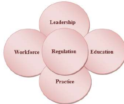
مجالات أولويات البحوث في التمريض

تهدف الأولويات البحثية في التمريض والقبالة إلى توجيه الباحثين نحو وضع الأبحاث العلمية التي تخدم الحاجات الصحية الوطنية، وتدعم الممارسة المبنية على أسس علمية، وقد تم تصنيفها إلى خمس مجالات بحثية رئيسية بما في ذلك تنظيم المهنة، والقيادة التمريضية، والقوى البشرية العاملة في المهنة والتعليم والممارسة، بالإضافة إلى إدراج خمسة إلى سبعة من الموضوعات البحثية تحت كل مجال.